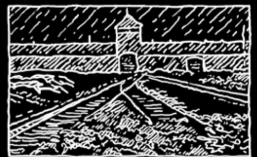
Fragment du monde - 2013 (détail).

Exposition Coté obscur, œuvres de David Molteau Du mercredi 3 avril au samedi 1er juin Tulle, médiathèque Eric Rohmer. (horaires d'ouverture au public) Présentation - vernissage le jeudi 4 avril à 18h