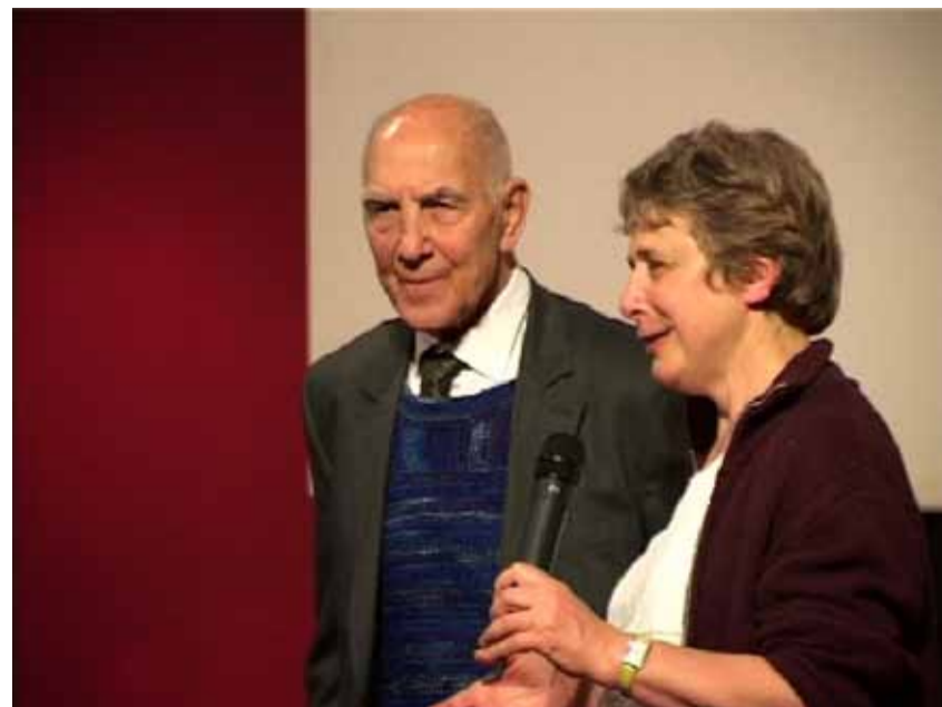
Stéphane Hessel, président d'honneur de Autour du 1er mai, Cinéma Le Palace, Tulle, Décade cinéma et société 2009.