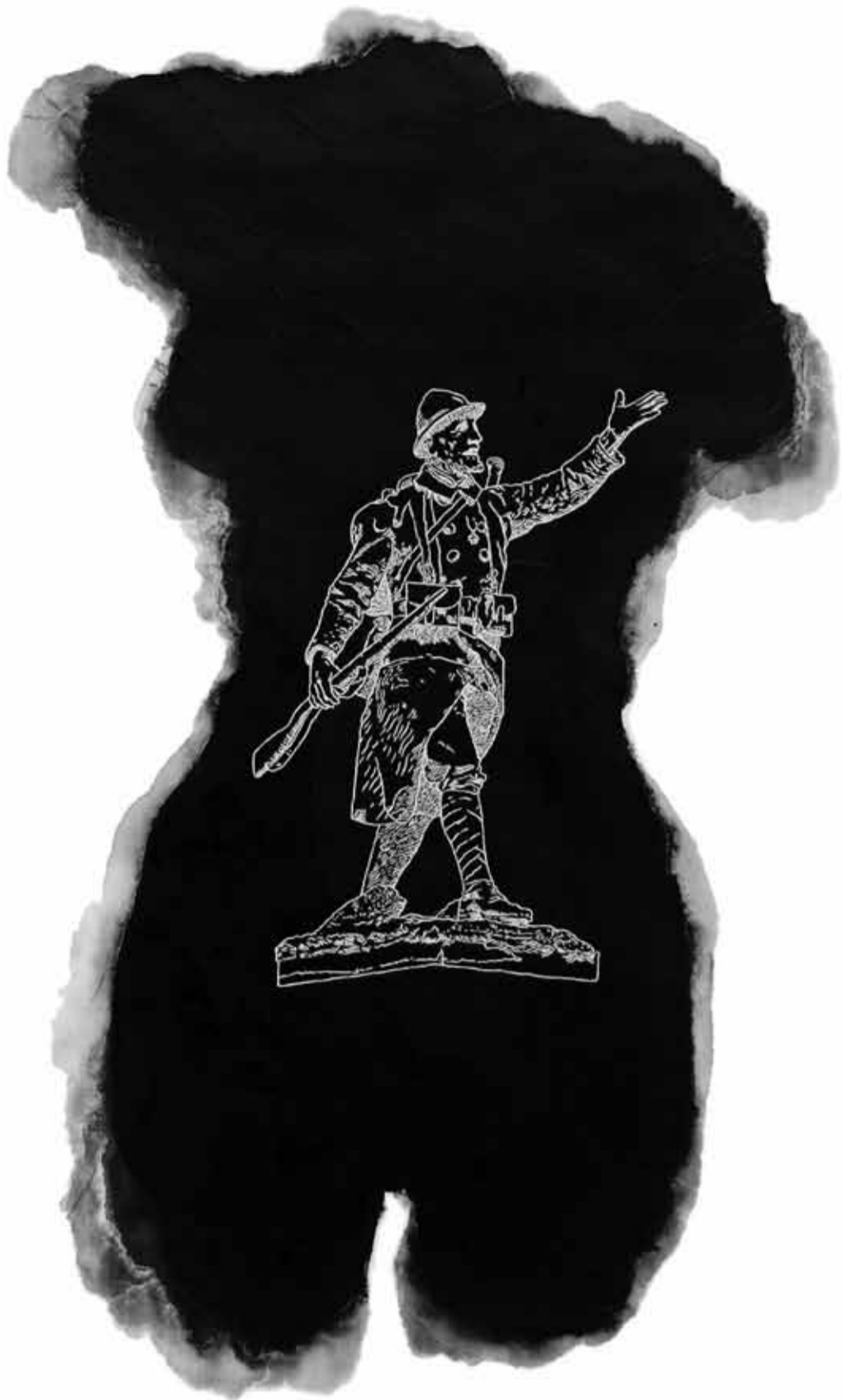
Les hétéros - 1914. 2013.