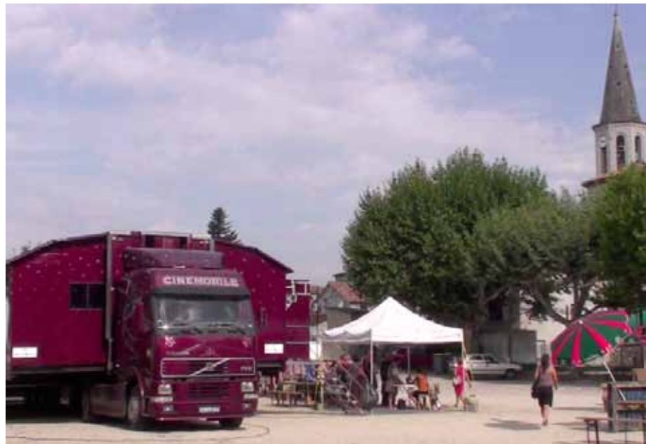
Lussas, États généraux du film documentaire 2012, un des (rares) lieux de pensée sur le cinéma et le monde.

La Région Limousin participe à l'activité cinéma documentaire et relais artothèque du Limousin de Peuple et Culture (dispositif "Emplois associatifs").